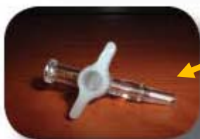
(Rubinetto ad una via in materiale plastico)

Il QT01727-V è un rubinetto ad una via utilizzato per chiudere la via di accesso o di uscita dei dispositivi utilizzati nei sistemi QuinTron per contenere i gas (sacche di raccolta dell'espriato, bombole di calibrazione, siringhe di trasporto o trasferimento, tubo essiccatore ecc.)